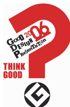
グッドデザイン・プレゼンテーション2006 オフィシャルロゴ(デザイン:佐藤可士和)